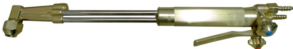
Рис. 1. Общий вид

На рисунке 1 показан общий вид резака для ручной кислородной резки.